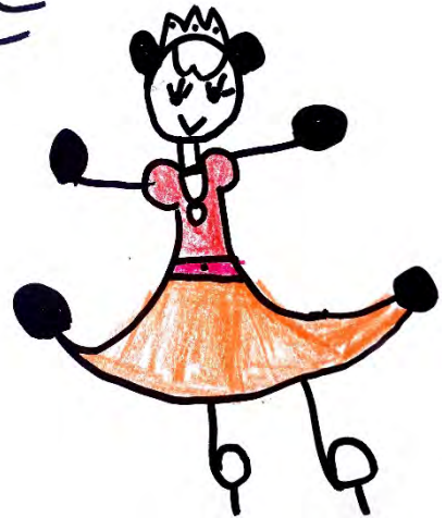
Desenho realizado por Manuela Ribeiro - 5 anos