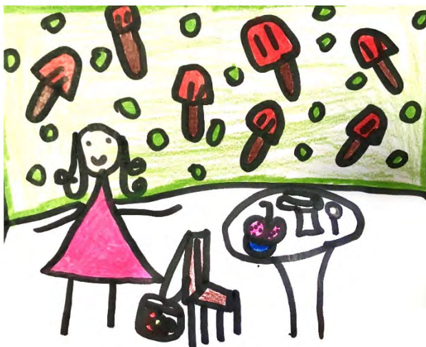
Desenho realizado por Manuela Ribeiro- 5 anos